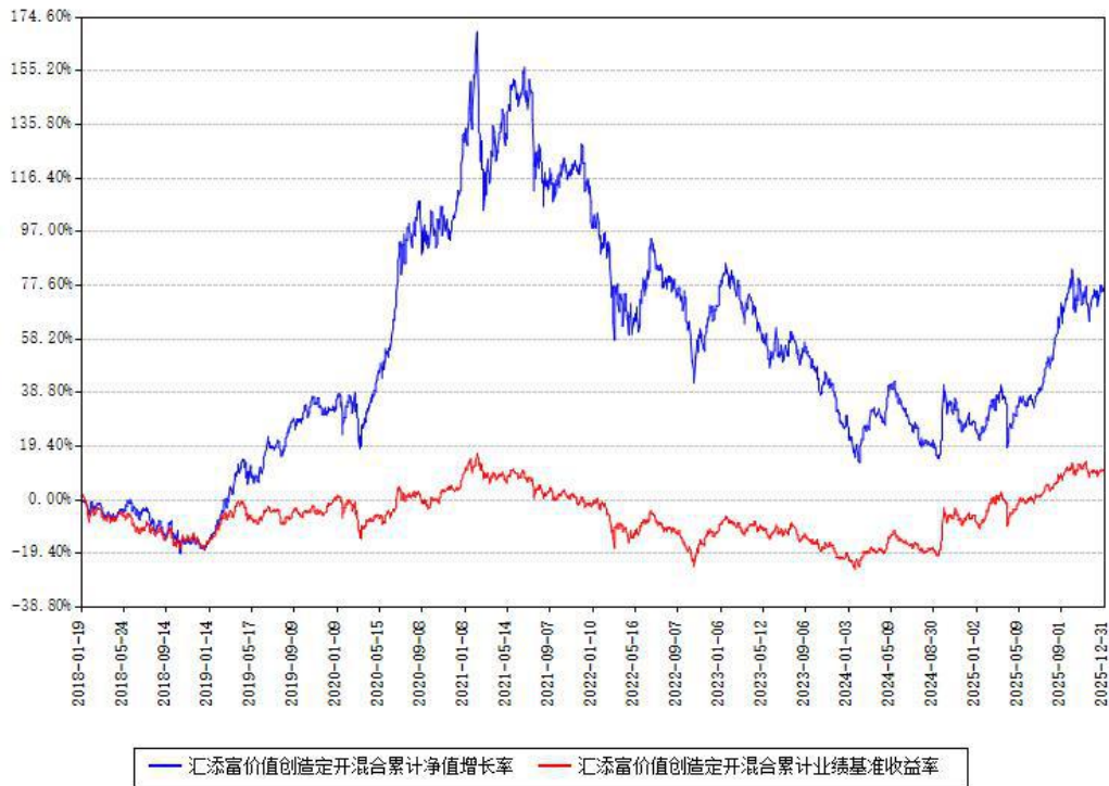
汇添富价值创造定开混合累计净值增长率与同期业绩比较基准收益率对比图

注：本基金建仓期为本《基金合同》生效之日（2018年01月19日）起6个月，建仓期结束时各项资产配置比例符合合同约定。