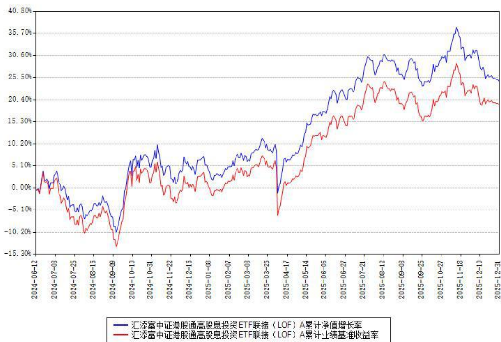
汇添富中证港股通高股息投资ETF联接 (LOF) A累计净值增长率与同期业绩基准收益率对 比图