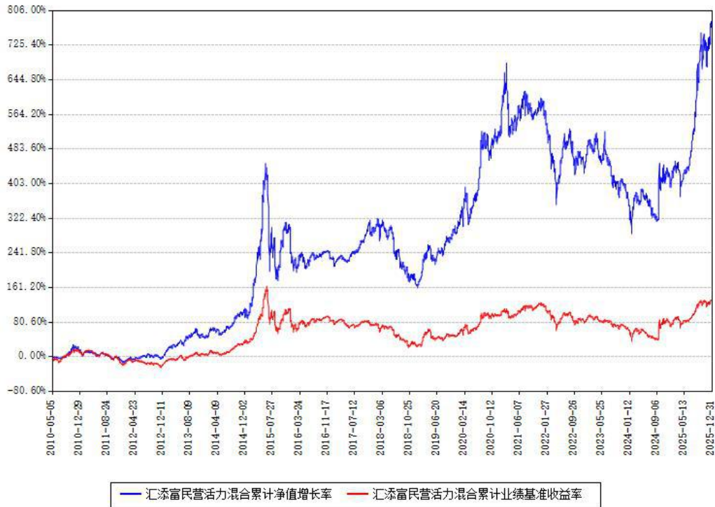
汇添富民营活力混合累计净值增长率与同期业绩基准收益率对比图

注：本基金建仓期为本《基金合同》生效之日（2010年05月05日）起6个月，建仓期结束时各项资产配置比例符合合同约定。