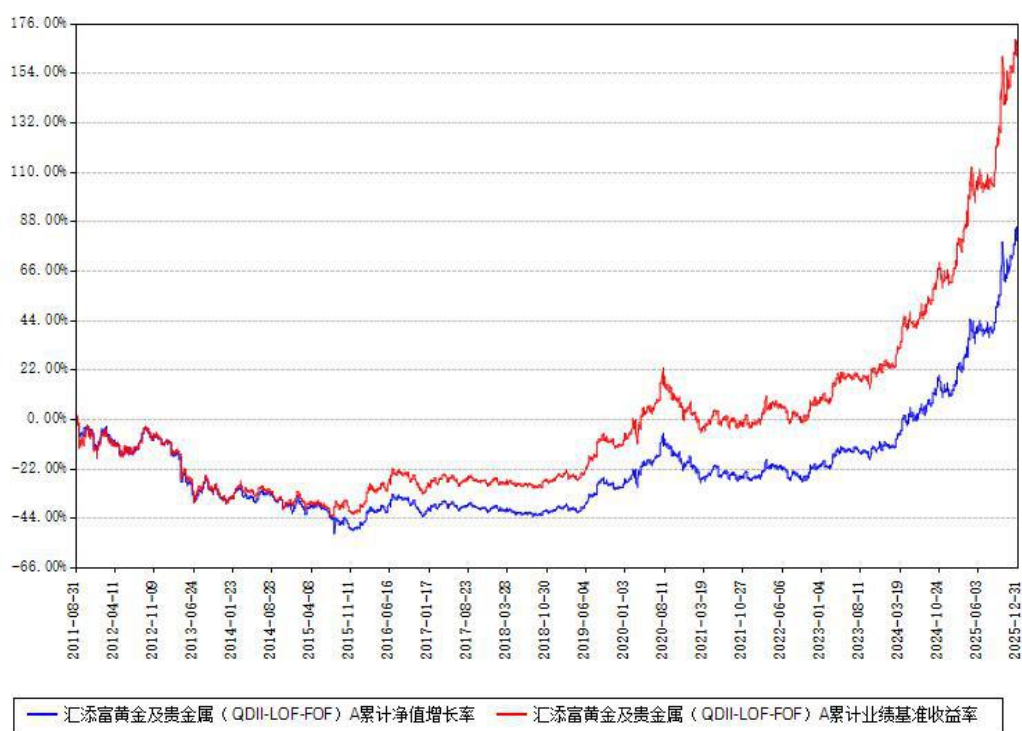
汇添富黄金及贵金属（QDII-LOF-FOF）A累计净值增长率与同期业绩基准收益率对比图