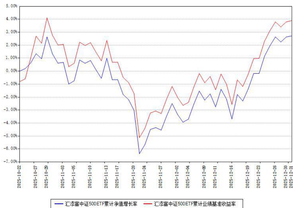
汇添富中证500ETF累计净值增长率与同期业绩基准收益率对比图

注：本《基金合同》生效之日为 2025 年 10 月 22 日，截至本报告期末，基金成立未满一年。本基金建仓期为本《基金合同》生效之日起 6 个月，截至本报告期末，本基金尚处于建仓期中。