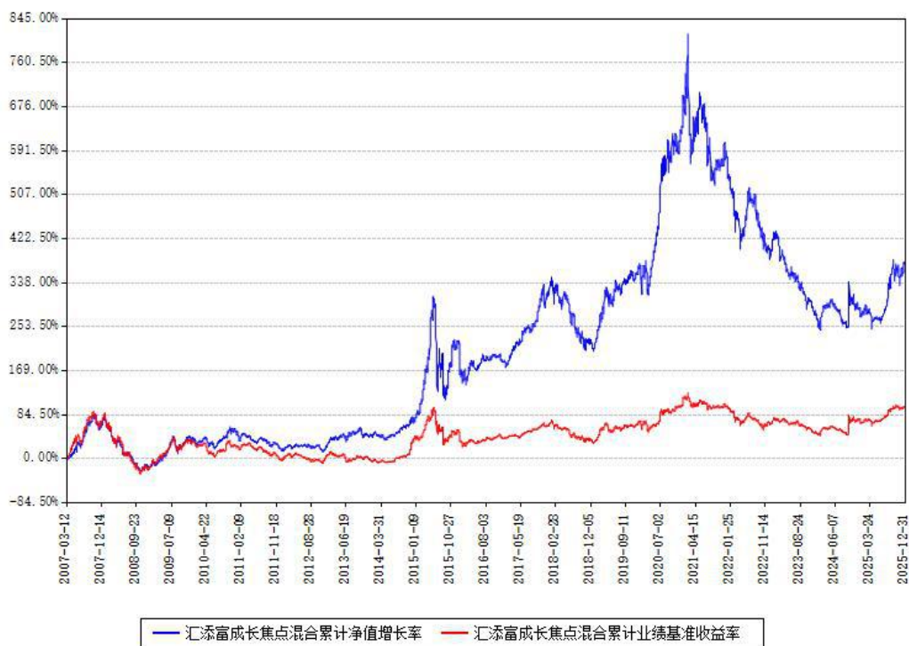
汇添富成长焦点混合累计净值增长率与同期业绩基准收益率对比图

注：本基金建仓期为本《基金合同》生效之日（2007年03月12日）起6个月，建仓期结束时各项资产配置比例符合合同约定。