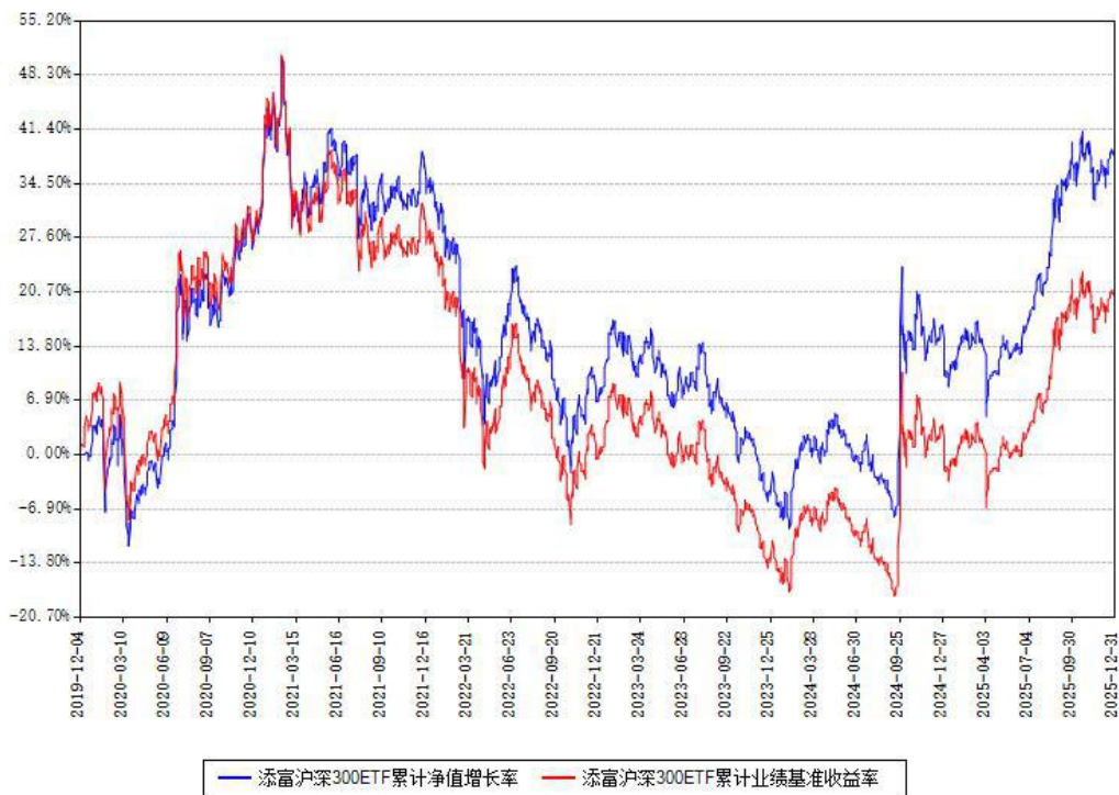
添富沪深300ETF累计净值增长率与同期业绩比较基准收益率对比图

注：本基金建仓期为本《基金合同》生效之日（2019年12月04日）起6个月，建仓期结束时各项资产配置比例符合合同约定。