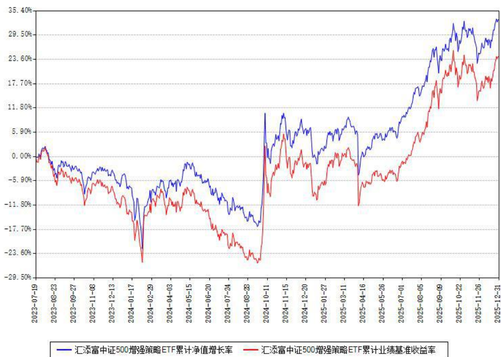
汇添富中证500增强策略ETF累计净值增长率与同期业绩基准收益率对比图

注：本基金建仓期为本《基金合同》生效之日（2023年07月19日）起6个月，建仓期结束时各项资产配置比例符合合同约定。