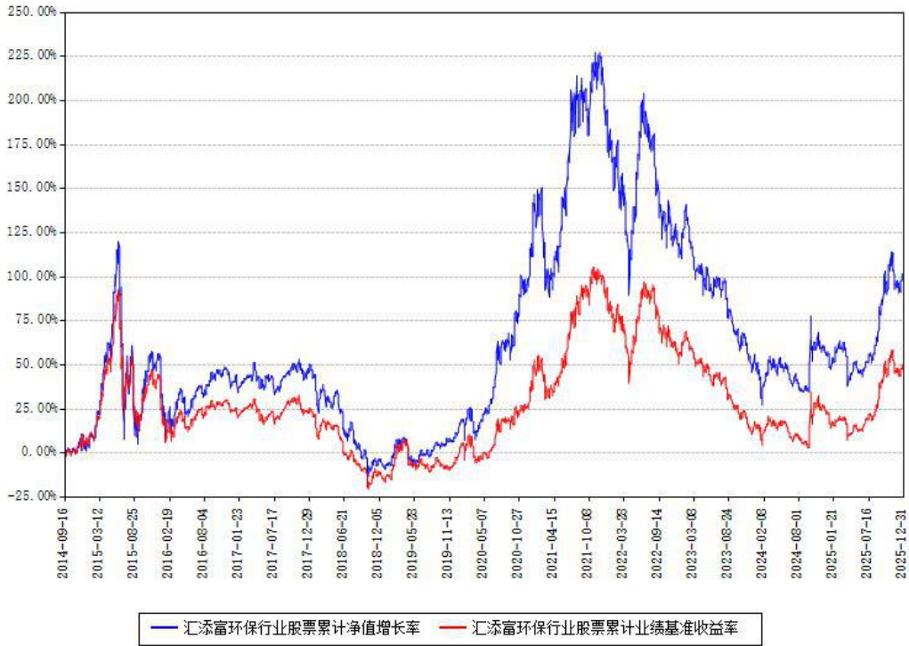
汇添富环保行业股票累计净值增长率与同期业绩基准收益率对比图

注：本基金建仓期为本《基金合同》生效之日（2014年09月16日）起6个月，建仓期结束时各项资产配置比例符合合同约定。