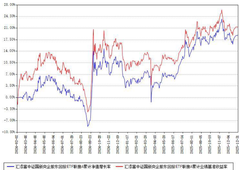
汇添富中证国新央企股东回报ETF联接A累计净值增长率与同期业绩基准收益率对比图