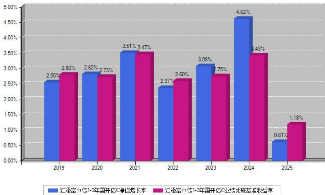
汇添富中债1-3年国开债C每年净值增长率与同期业绩基准收益率对比图

注：数据截止日期为2025年12月31日，基金的过往业绩不代表未来表现。本《基金合同》生效之日为2019年04月15日，合同生效当年按实际存续期计算，不按整个自然年度进行折算。