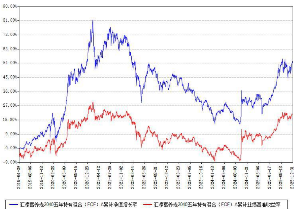
汇添富养老2040五年持有混合 (FOF) A 累计净值增长率与同期业绩基准收益率对比图