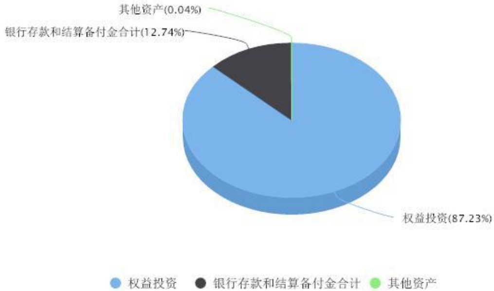
投资组合资产配置图表 数据截止日期:2025年12月31日