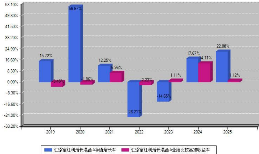
汇添富红利增长混合A每年净值增长率与同期业绩基准收益率对比图

注：数据截止日期为2025年12月31日，基金的过往业绩不代表未来表现。本《基金合同》生效之日为2019年04月26日，合同生效当年按实际存续期计算，不按整个自然年度进行折算。