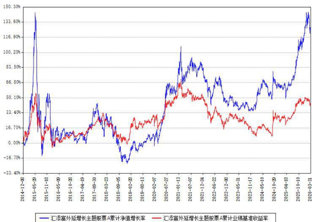
汇添富外延增长主题股票A累计净值增长率与同期业绩基准收益率对比图