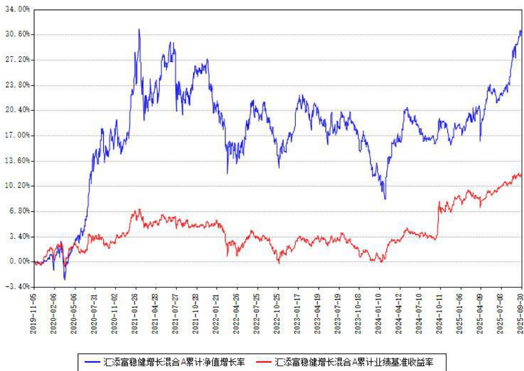
汇添富稳健增长混合A累计净值增长率与同期业绩基准收益率对比图