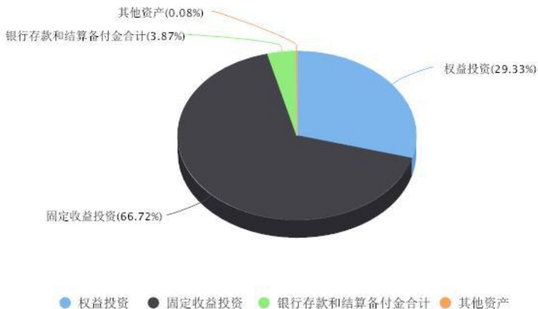
投资组合资产配置图表 数据截止日期:2025年09月30日