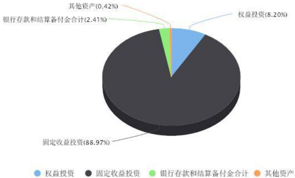
投资组合资产配置图表 数据截止日期:2025年06月30日