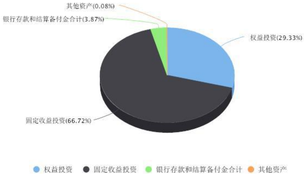
投资组合资产配置图表 数据截止日期:2025年09月30日