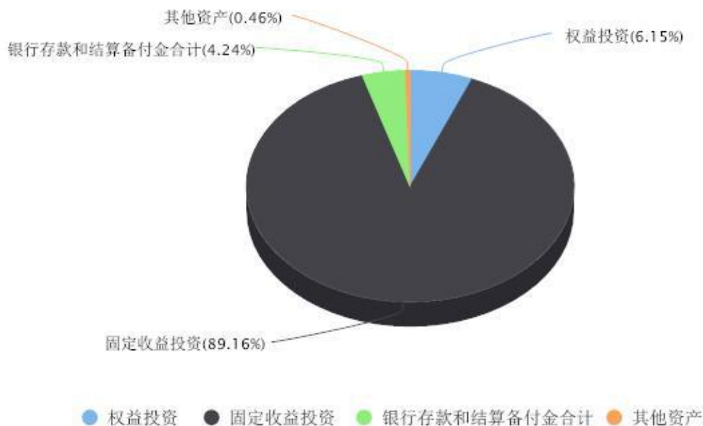
投资组合资产配置图表 数据截止日期:2026年03月31日