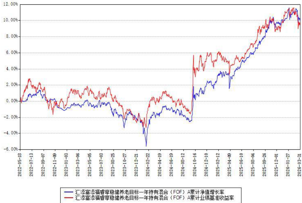
汇添富添福睿享稳健养老目标一年持有混合(FOF)A累计净值增长率与同期业绩基准收益率对比图