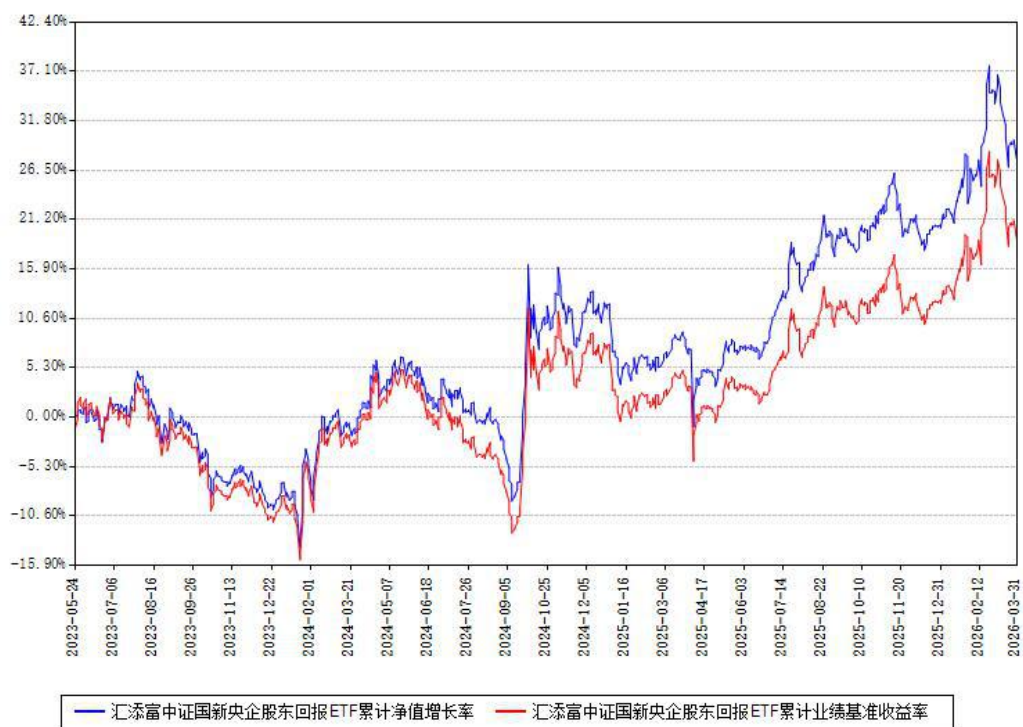
汇添富中证国新央企股东回报ETF累计净值增长率与同期业绩基准收益率对比图