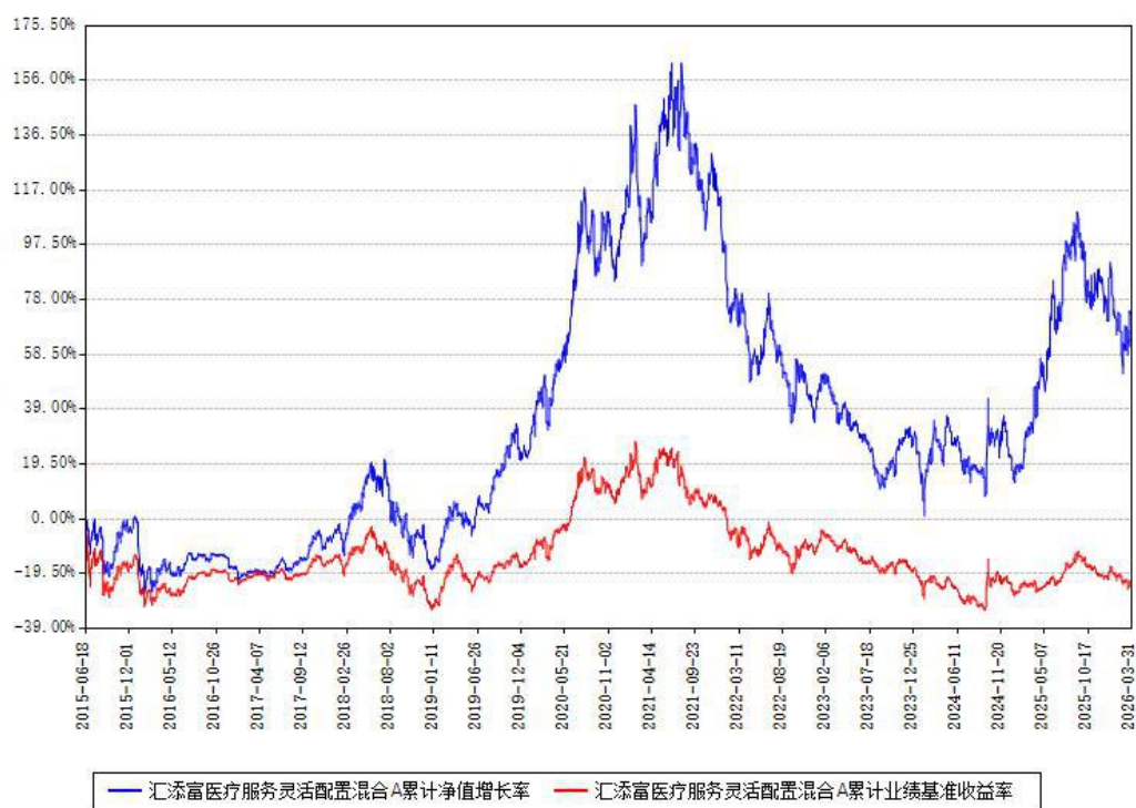
汇添富医疗服务灵活配置混合A累计净值增长率与同期业绩基准收益率对比图