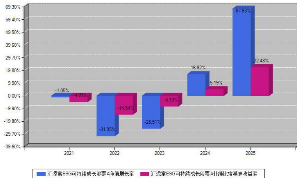
汇添富ESG可持续成长股票A每年净值增长率与同期业绩基准收益率对比图

注：数据截止日期为2025年12月31日，基金的过往业绩不代表未来表现。本《基金合同》生效之日为2021年06月10日，合同生效当年按实际存续期计算，不按整个自然年度进行折算。