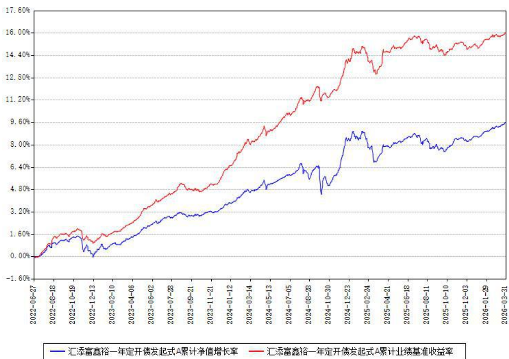
汇添富鑫裕一年定开债发起式A累计净值增长率与同期业绩基准收益率对比图