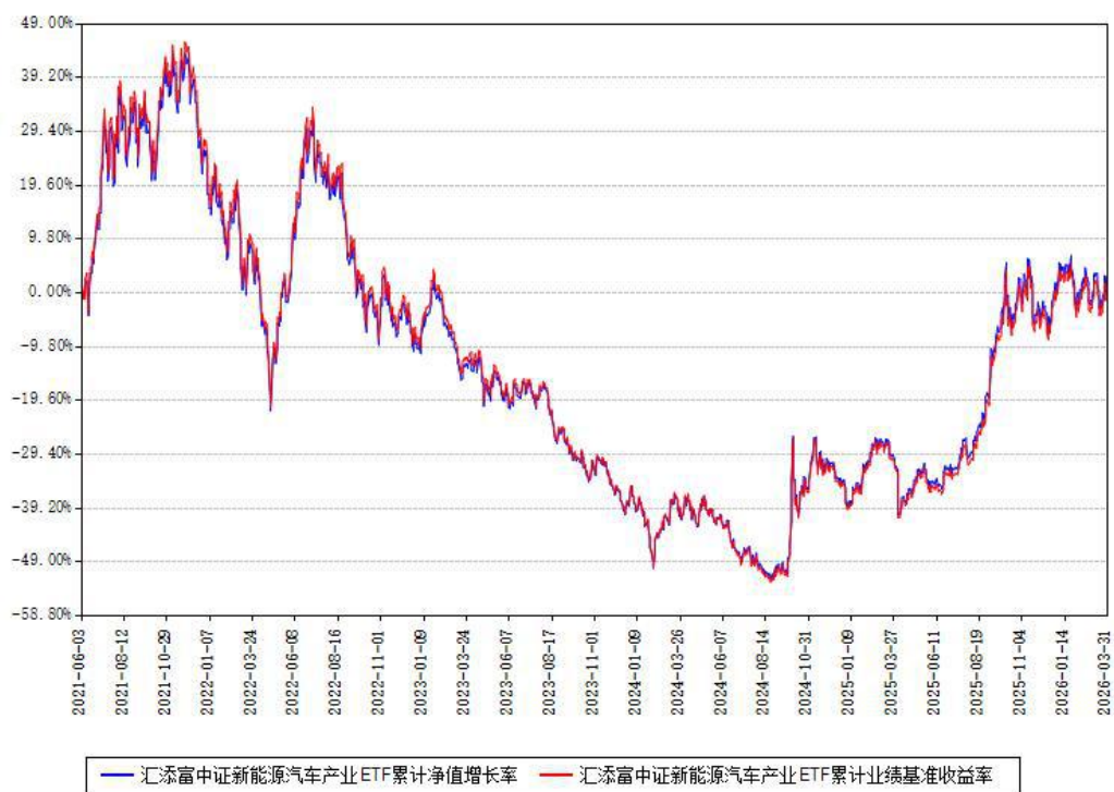
汇添富中证新能源汽车产业ETF累计净值增长率与同期业绩基准收益率对比图