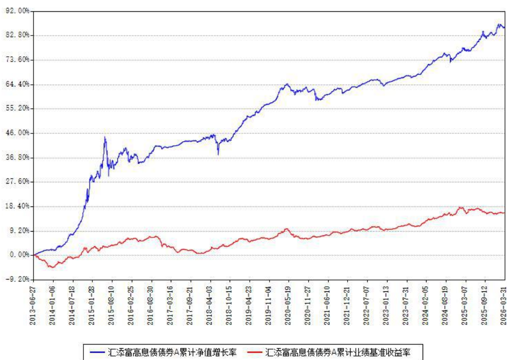
汇添富高息债债券A累计净值增长率与同期业绩基准收益率对比图

(二) 自基金合同生效以来基金累计净值增长率变动及其与同期业绩比较基准收益率变动的比较图