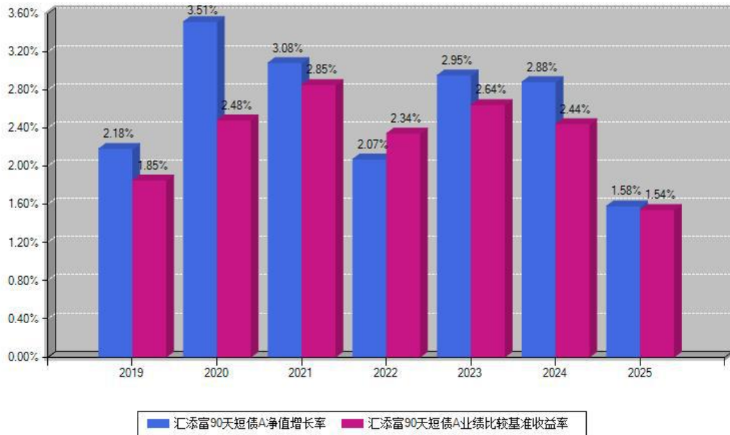
汇添富90天短债A每年净值增长率与同期业绩基准收益率对比图

注：数据截止日期为2025年12月31日，基金的过往业绩不代表未来表现。本《基金合同》生效之日为2019年06月12日，合同生效当年按实际存续期计算，不按整个自然年度进行折算。