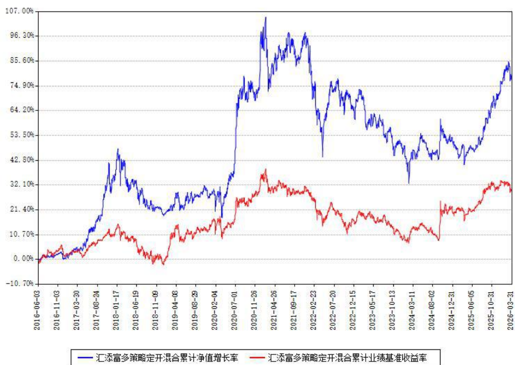
汇添富多策略定开混合累计净值增长率与同期业绩基准收益率对比图