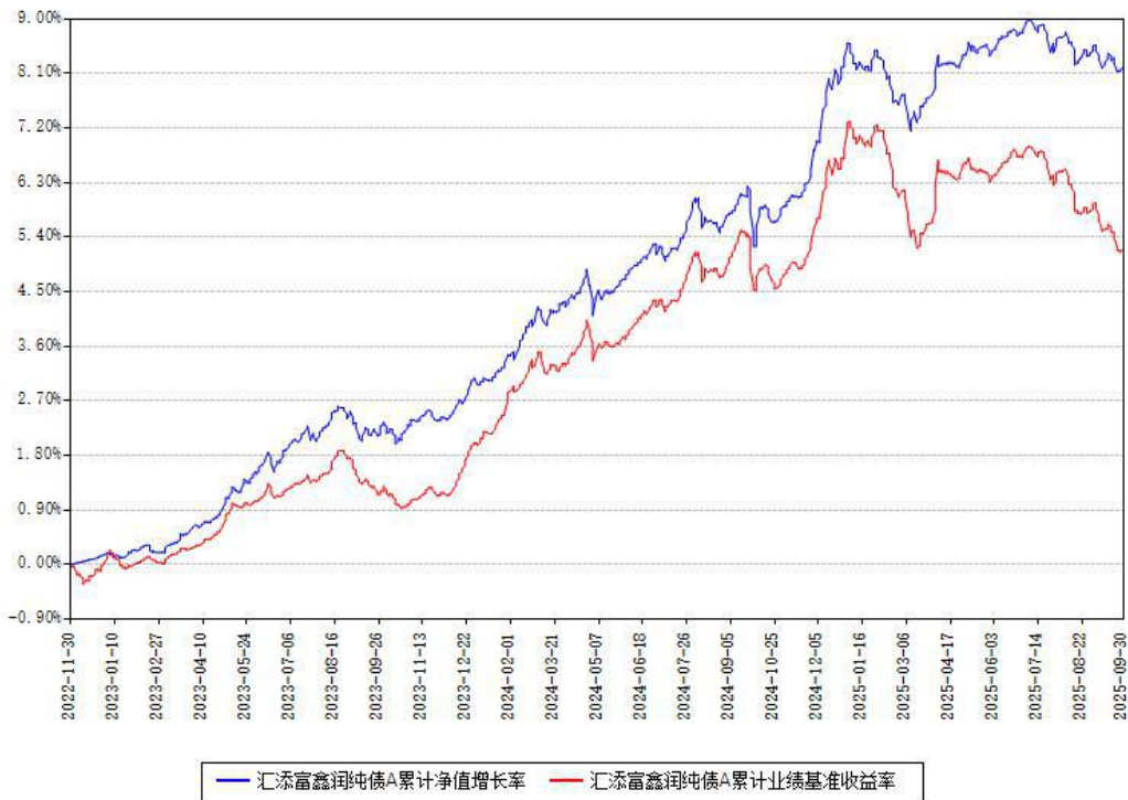
汇添富鑫润纯债A累计净值增长率与同期业绩基准收益率对比图

(二) 自基金合同生效以来基金累计净值增长率变动及其与同期业绩比较基准收益率变动的比较图