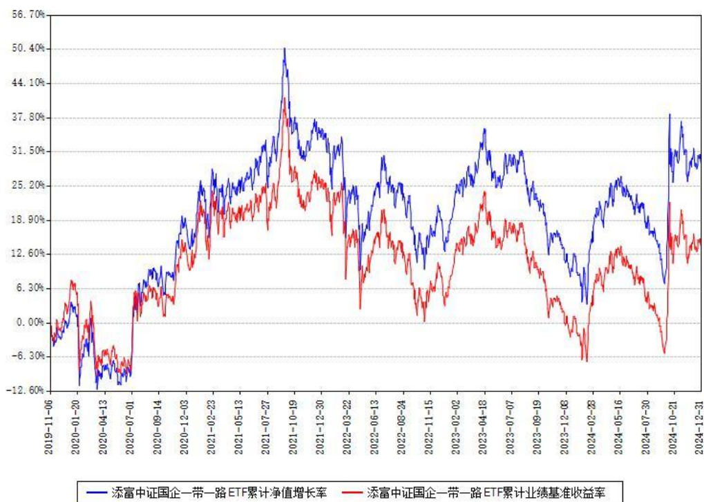
添富中证国企一带一路ETF累计净值增长率与同期业绩比较基准收益率对比图

注：本基金建仓期为本《基金合同》生效之日（2019年11月06日）起6个月，建仓期结束时各项资产配置比例符合合同约定。