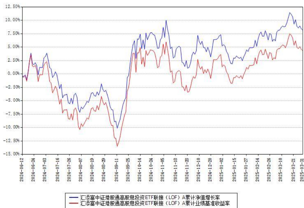
汇添富中证港股通高股息投资ETF联接(LOF) A累计净值增长率与同期业绩基准收益率对比图